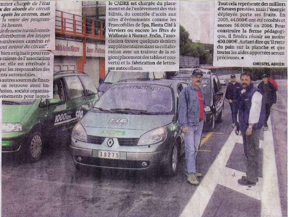
Les volontaires de l'asbl CADRE passent de nombreuses heures à travailler sur le circuit de Francorchamps.